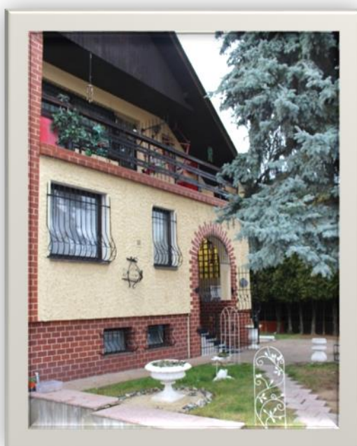
Crime scene, Běla’s villa in Úvaly u Prahy